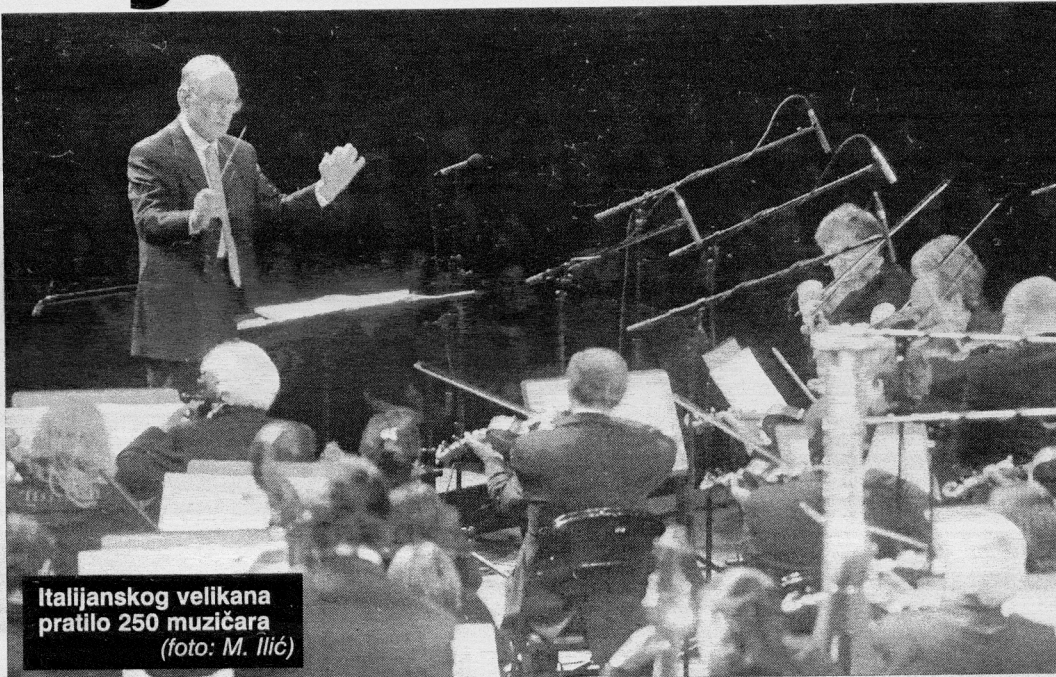
Italijanskog velikana pratilo 250 muzičara

Koncert je počeo Morikoneovom muzikom za gitaru, njegovim