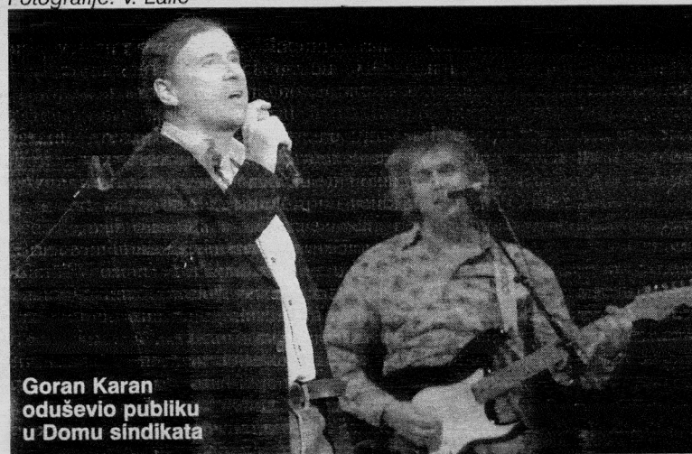
Goran Karan oduševio publiku u Domu sindikata

vač i kompozitor Goran Karan. Publiku je pozdravio kratkim "Dobro veće Beograde" i krenuo sa pesmom "Obriši suze dušo moja", što je publika sa oduševljenjem prihvatila. Redali su se stariji i novi hitovi, ali je bilo i obrada koje se inače retko sviraju. Karana je beogradska